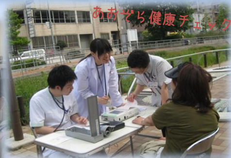
あおぞら健康チェック