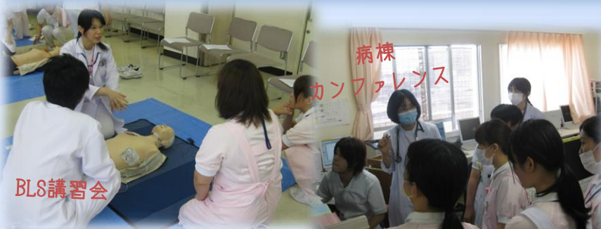
病棟 カンファレンス