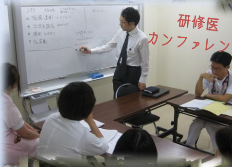
研修医 カンファレンス